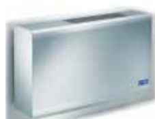
EW mit verstellbarer Ausblasöffnung. Speziell für Wandmontage

Weitere Truhen finden Sie in unserer speziellen SET-Preisliste oder unter www.aquasolar.ch