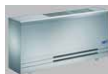
E mit verstellbaren Ausblasöffnungen. Gehäuse komplett aus Aluminium. Standmodell