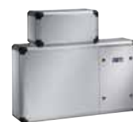
H / H-MC zur Aufstellung in einen frostfreien zur Schwimmhalle angrenzenden Raum