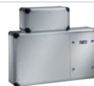
H / H-MC

mit verstellbaren Ausblasöffnungen. Gehäuse komplett aus Aluminium. Standmodell